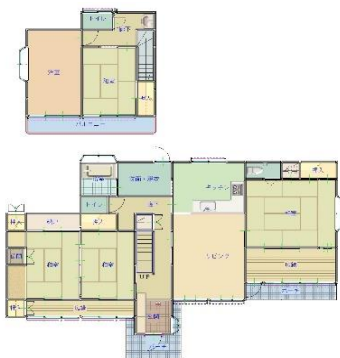
間取り図(現況優先)