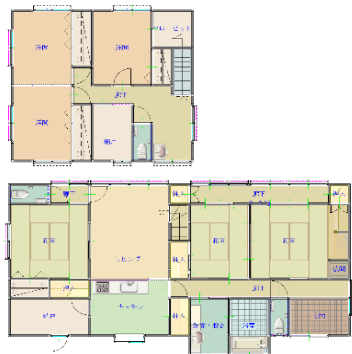
間取り図(現況優先)