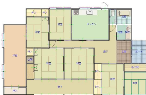
間取り図(現況優先)